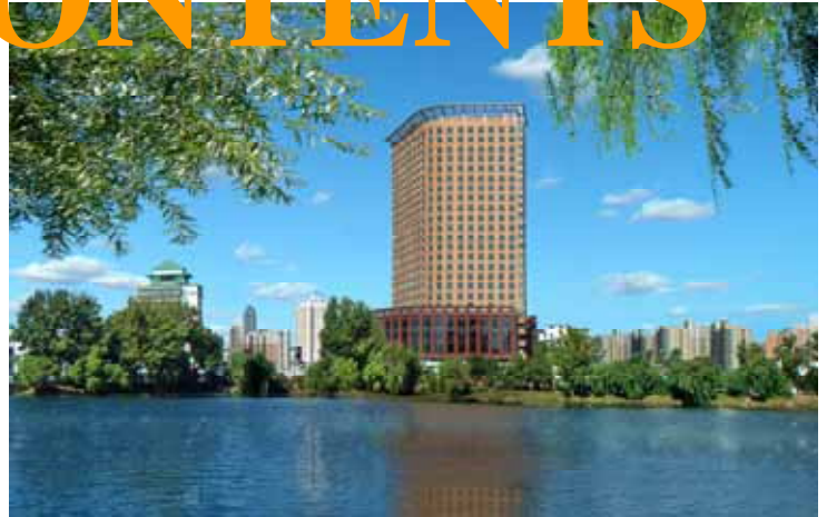
沈阳凯宾斯基酒店