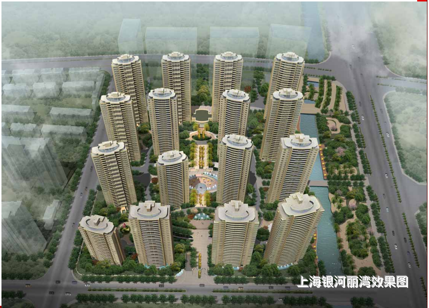
上海银河丽湾效果图